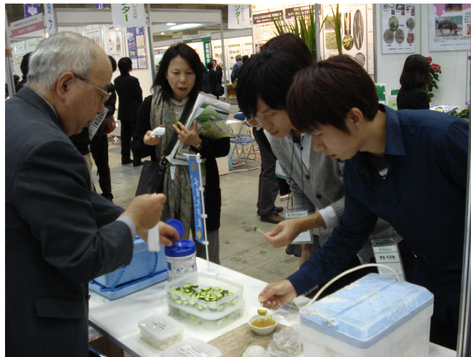
乳化すり身入りディップソースの試食の様子