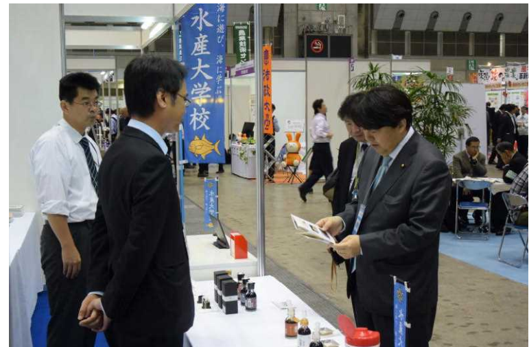
本校教員の説明を聞かれる 林 前農林水産大臣