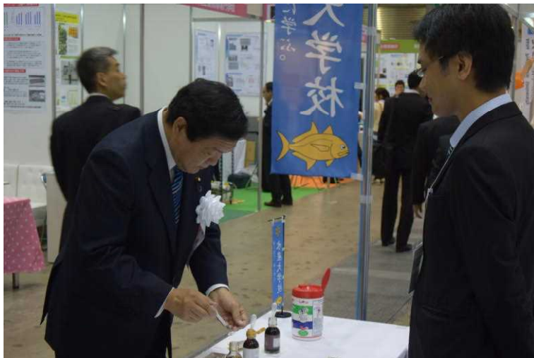
魚醤を試飲される 伊東 農林水産副大臣