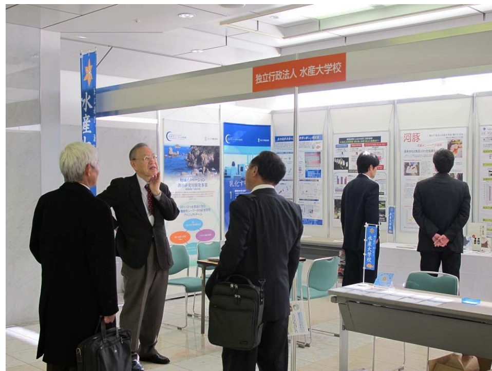
本校ブースが複数の来場者でにぎわっている様子