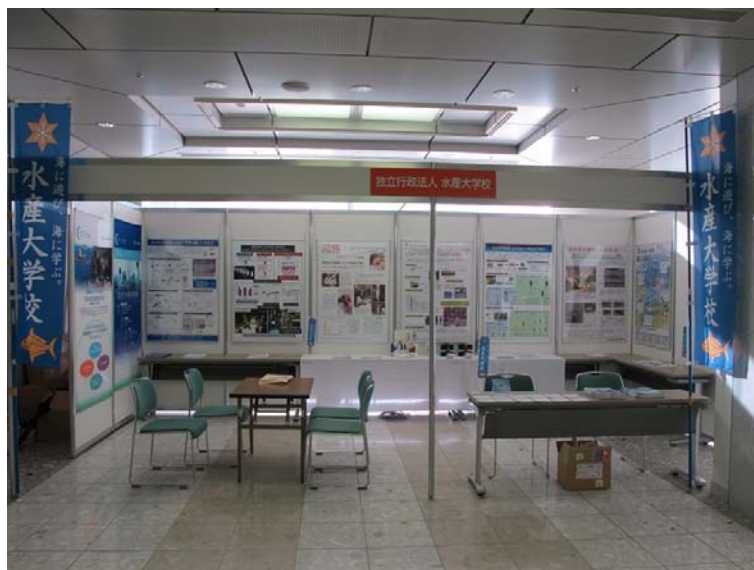
本校ブースの全体図