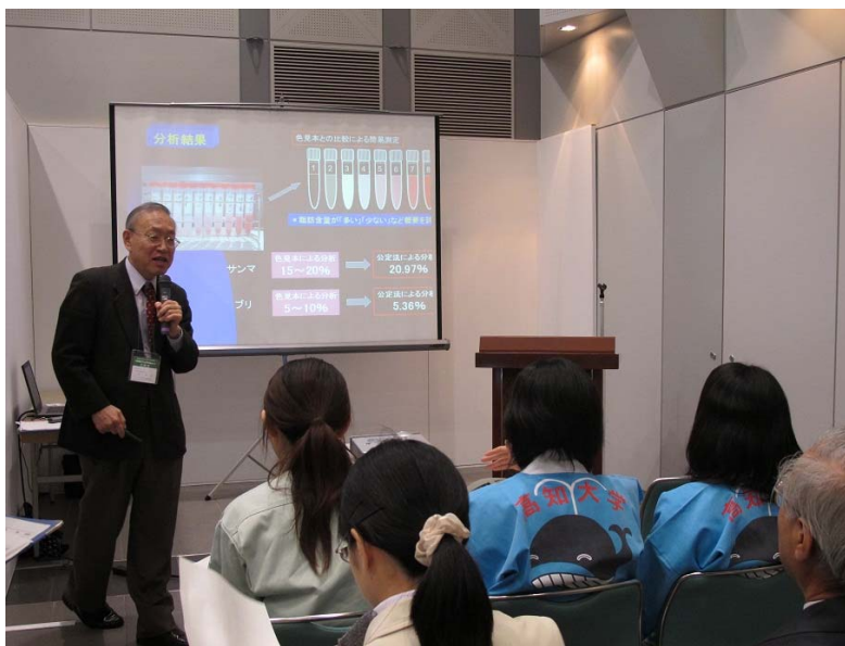
芝先生がプレゼンテーションを行っている様子