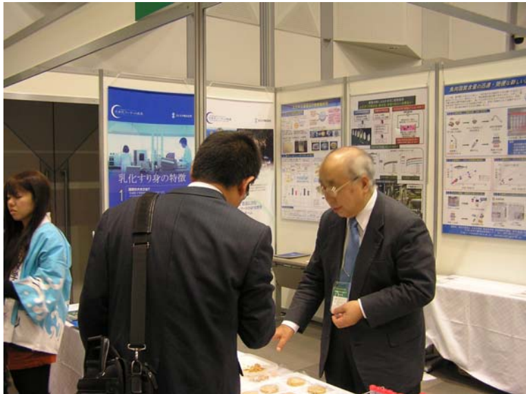
DHA等を配合したすり身入りクッキーの試食および説明の様子