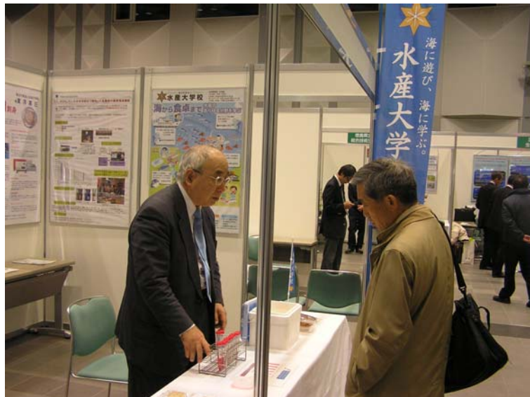
簡易脂質測定キットのサンプルについて説明している様子