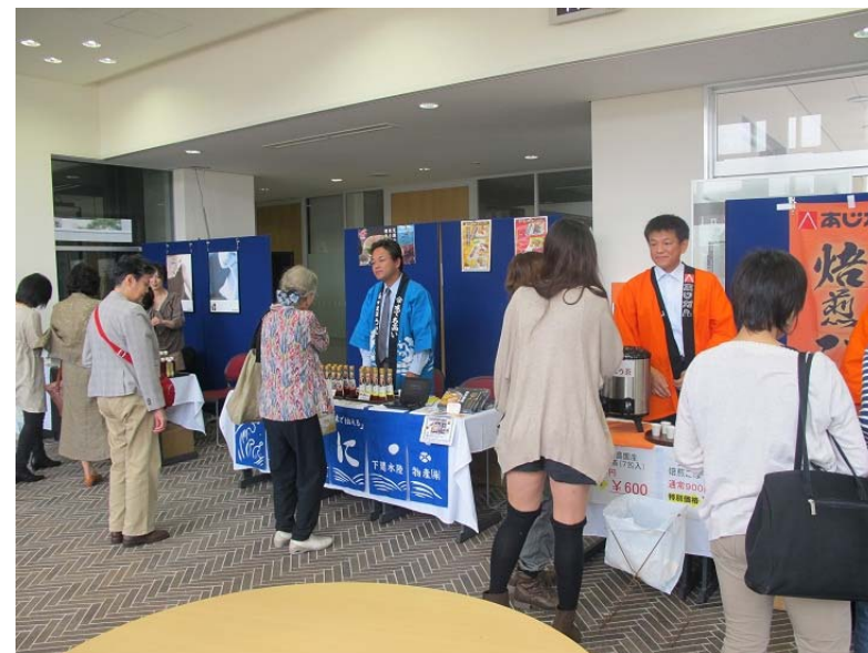
企業による物販・物産展示