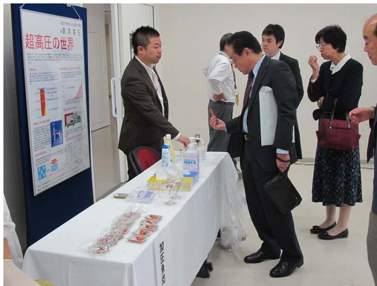
高圧処理した食品の試食