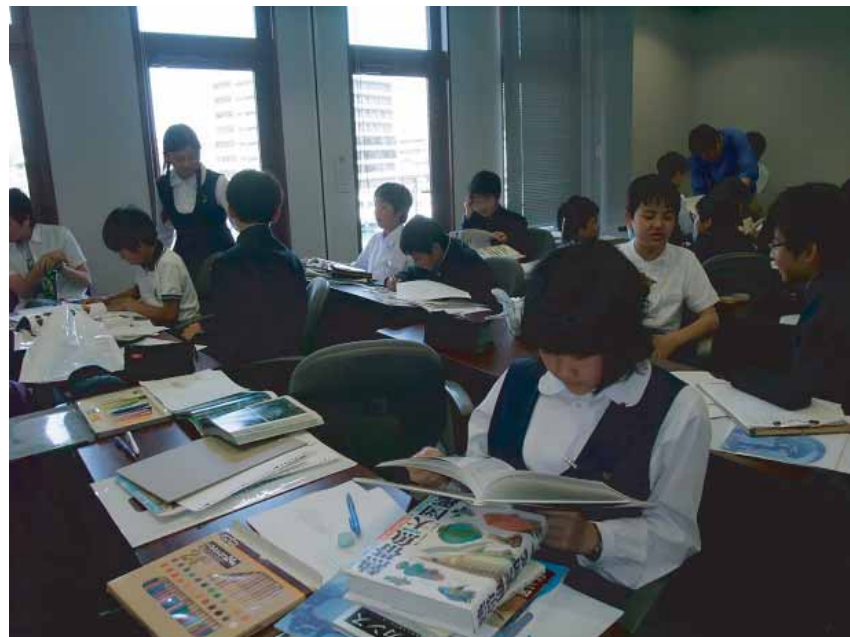
図鑑や専門書を用いた調べ学習