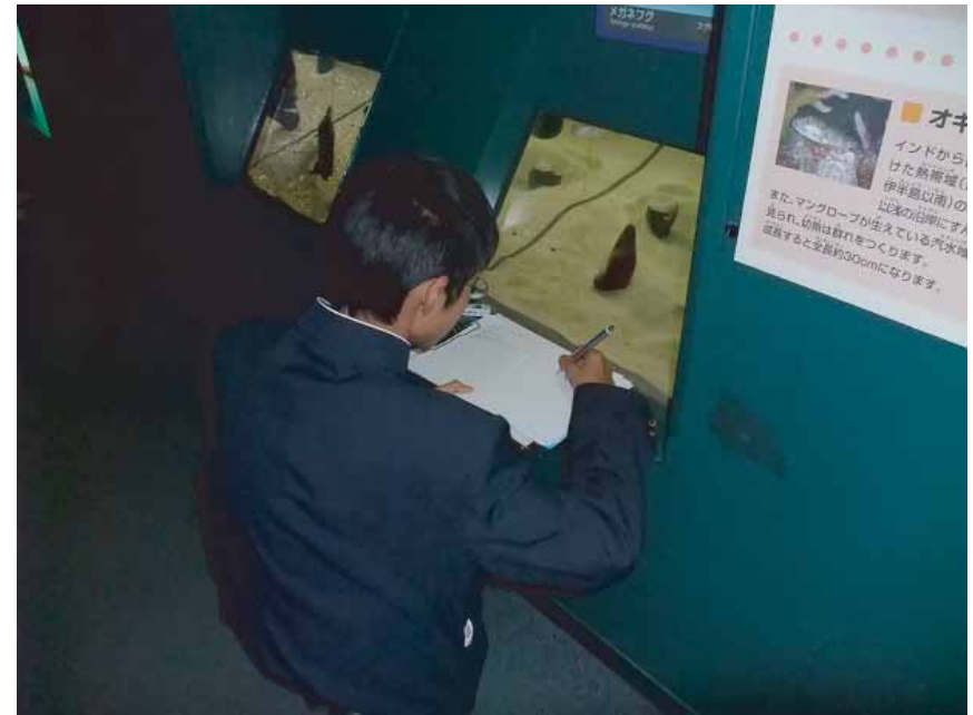
海響館内での魚介類の観察