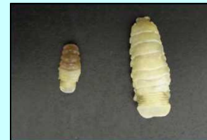
ウオノエ類 (魚類の口腔内に 寄生する甲殻類)