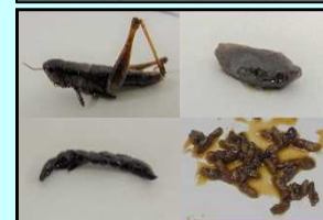
食用昆虫 (イナゴ, ザザムシ, カイコガ蛹, ハチノコなど)