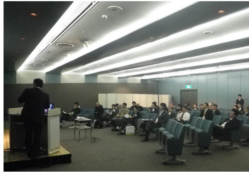
お刺身を美味しくする技術を紹介した本校のセミナー