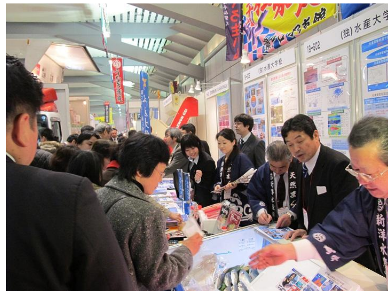
とても多くの来場者で賑った本校ブースの様子