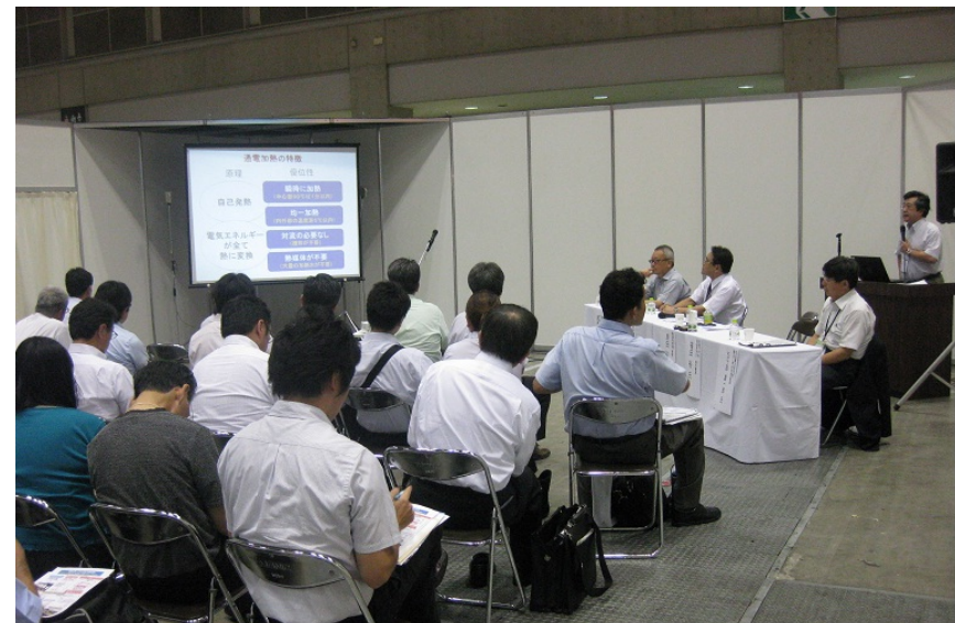
セミナーは、とても多くの方々に聴いていただくことができました。