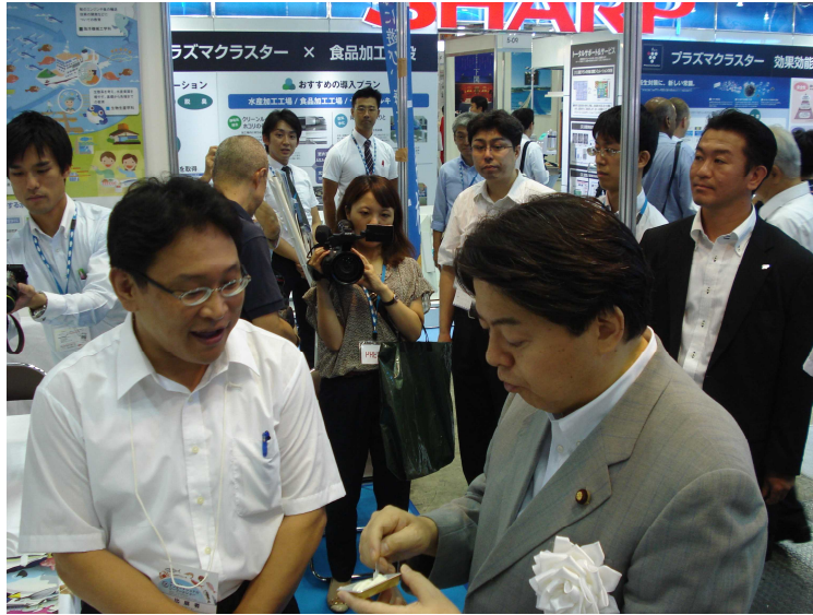
乳化魚肉すり身入りアイスクリームを試食する林農林水産大臣