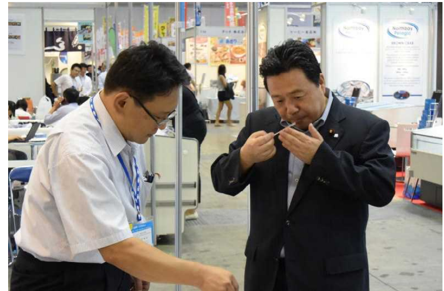
オキアミ魚味噌を試食される佐藤農林水産政務官