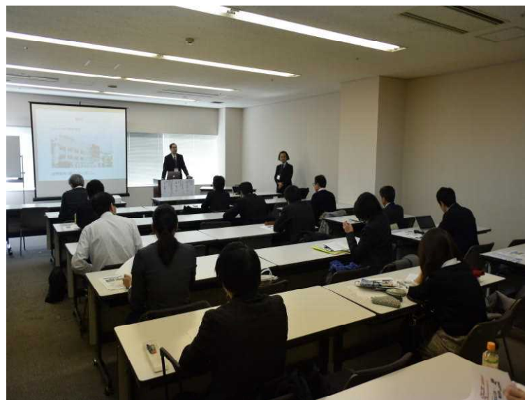
「水産大学校セミナー」