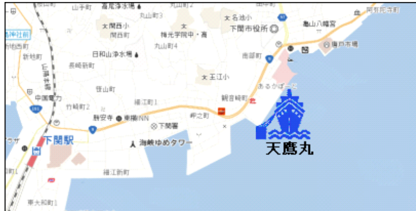
練習船天鷹丸竣工披露式会場周辺図